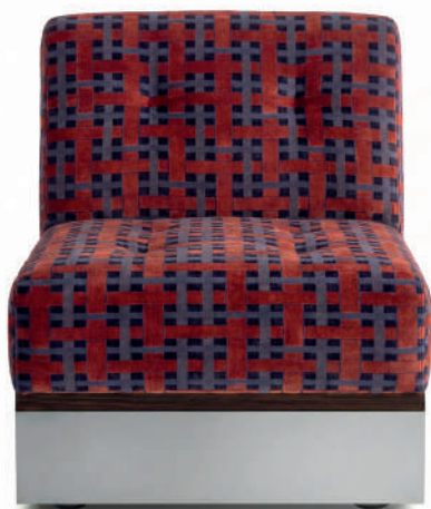
Velours Lacis Acajou