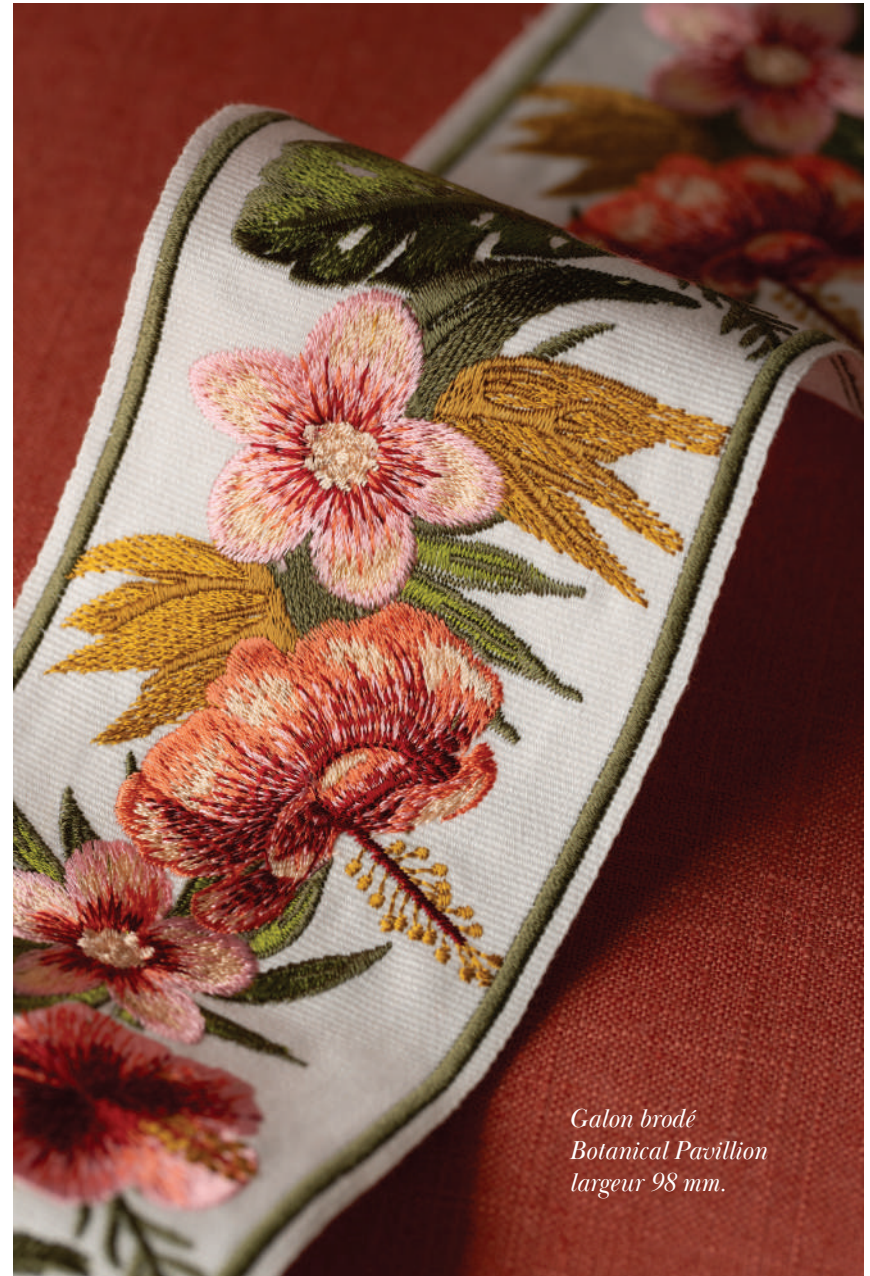
Galon brodé Botanical Pavillion largeur 98 mm.