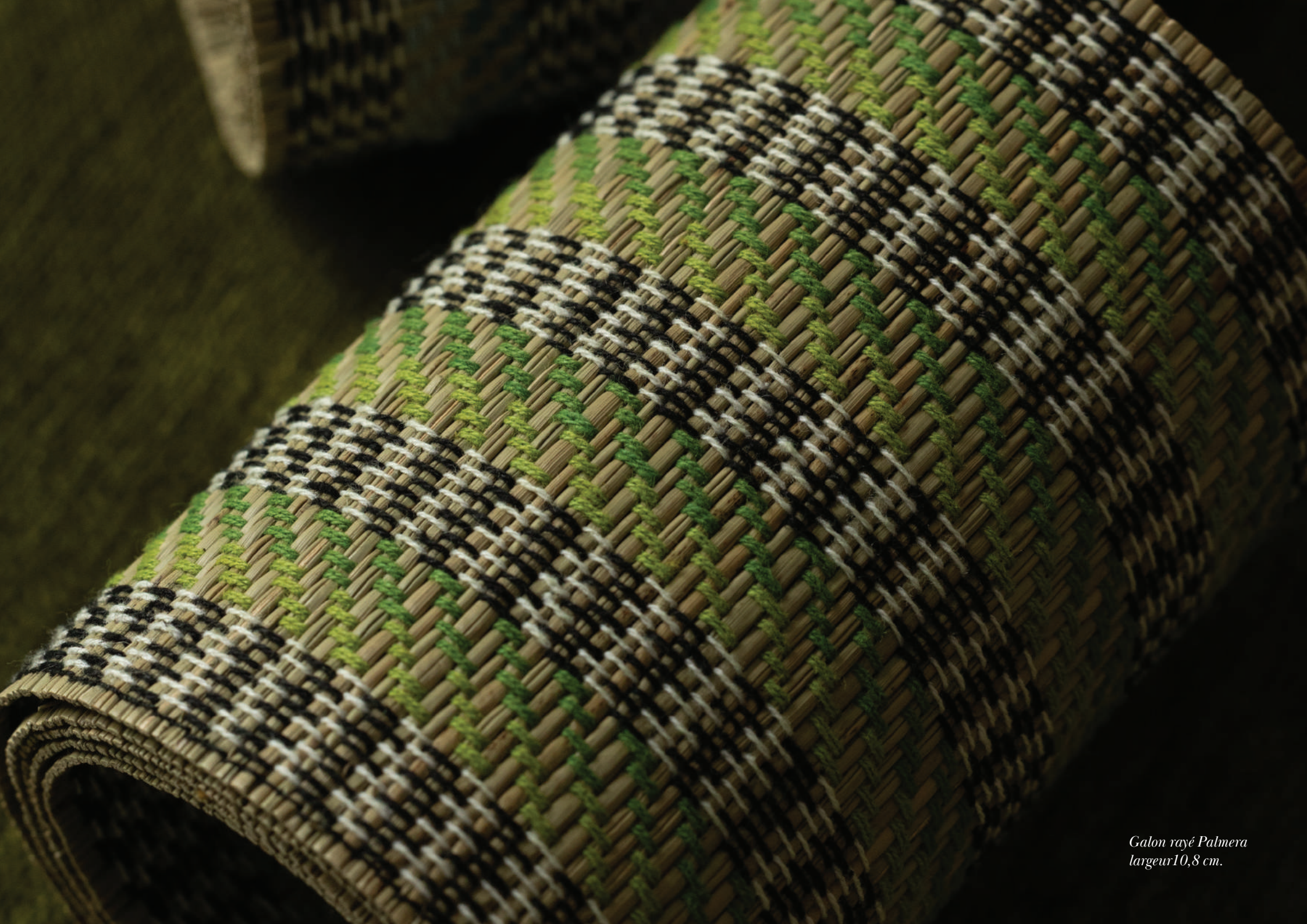
Galon rayé Palmera largeur 10,8 cm.