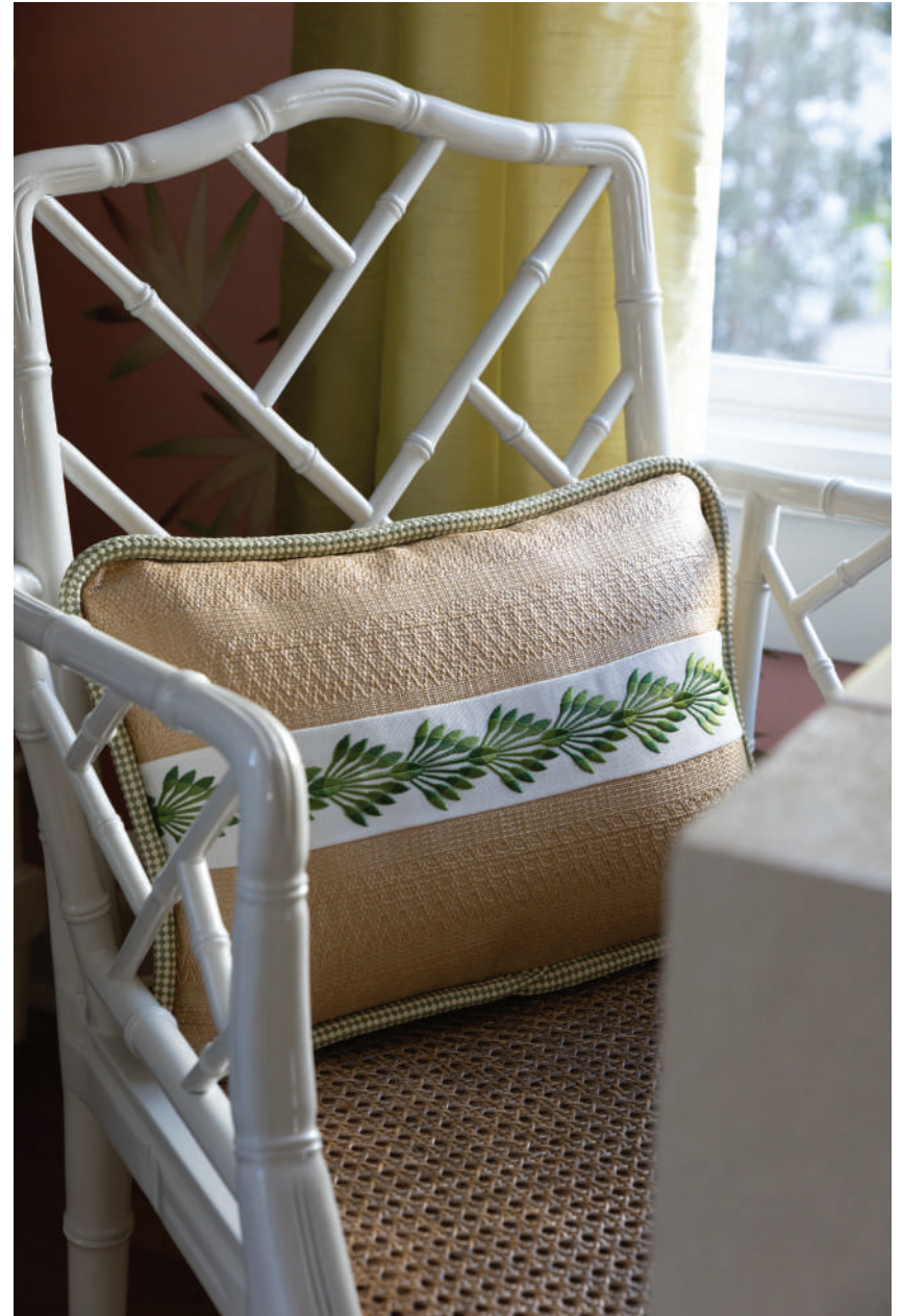
Gauche : rideau : galon brodé Palm, largeur 98 mm, store : galon brodé Tropic, largeur 51 mm. Droite : galon brodé Palmetto Crest, largeur 73 mm.