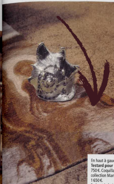
En haut à gauche. Tapis Adrien Testard pour Maison Péchavy, 750 €. Coquillage en argent, collection Marina, Buccellati, 1 650 €.