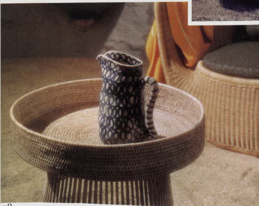
À gauche. Bout de canapé Togo, Flamant, 345 €. Pichet Charly, en grès peint, Marie Michielssen pour Serax, 115 €. Fauteuil Afternoons, en aluminium et PVC tressé à la main, Omi Tahara pour DePadova. Drap de plage Croisière, avec bourdon blanc, Yves Delorme, 95 €.