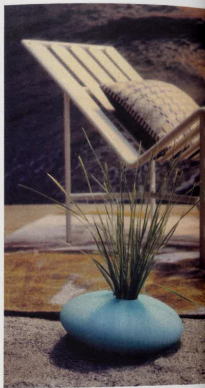
Ci-dessus. Tapis Songes, en fibres recyclées, Adrien Testard pour Maison Péchavy, 750 €. Bain de soleil Cosimo de' Medici, en inox laqué, Muller Van Severen pour Tectona, 1 990 €. Coussin Cannage, Dior Maison, 670 €. Vase Achille, en verre de Murano, Armani Casa, 2 950 €.