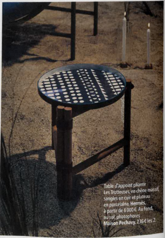
Table d'appoint pliante Les Trotteuses, en chêne massif, sangles en cuir et plateau en porcelaine, Hermès, à partir de 6 000 €. Au fond, au sol, photophores Maison Pechavy, 236 € les 2.

À gauche, bain de soleil, Muller Van Severen pour Tectona, 1 990 €. Dessus, coussin Carnage, Dior Maison, 670 €. À droite, fauteuil Trio Outdoor, en teck, studio MK27 pour Minotti chez Silvera, 6 209,80 €. Tapis Songe, Adrien Testard pour Maison Pechavy, 750 €. Coquillage en argent, collection Marina, Buccellati, 1 650 €. Sur l'accoudoir et dans le sable, vases Achille, en verre de Murano, Armani Casa, 2 950 € pièce. Décor panoramique sur mesure Sunset at the North Sea Coast, wallism.fr.