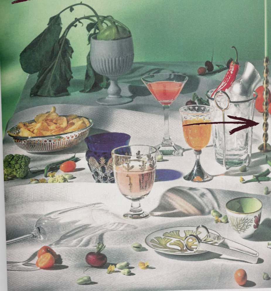
Maison Pechavy - Bougeoir «Perles» Little Greene - Peinture «Garden»

De bas en haut. Flûte Rose Garden, Villeroy & Boch, 49,90 € les 4. Assiette à pain et bol Natures Marines, Hermès, 130 € et 280 €. Pince et seau à glace Latitude, Ercuis, 100 € et 330 €. Verre à motifs Marchese, Ginori 1735, 320 €. Gobelet Tsar, en verre soufflé de Murano, Baccarat, 2 900 €. Verre à vin Caviar, en argent et clair et bleu, Baccarat, 2 900 €. Verre à Martini, en verre soufflé de Murano, Baccellati, 770 €. Verre à Martini, Maxime d'Angeac pour Moser, prix sur demande. Corbeille à pain Albi, Christofle, 450 €. Timbale à champagne Cheval, en argent, Puiforcat, 1 420 €. Bougeoir Perles et bougie fine, Maison Pechavy, 99 € et 23 € la boîte de 10. Bol sur pied Victoria, Astier de Villatte, 159 €. Nappe Portofino, Le Jacquard Français, 329 €. Peinture coloris Garden, Little Greene.