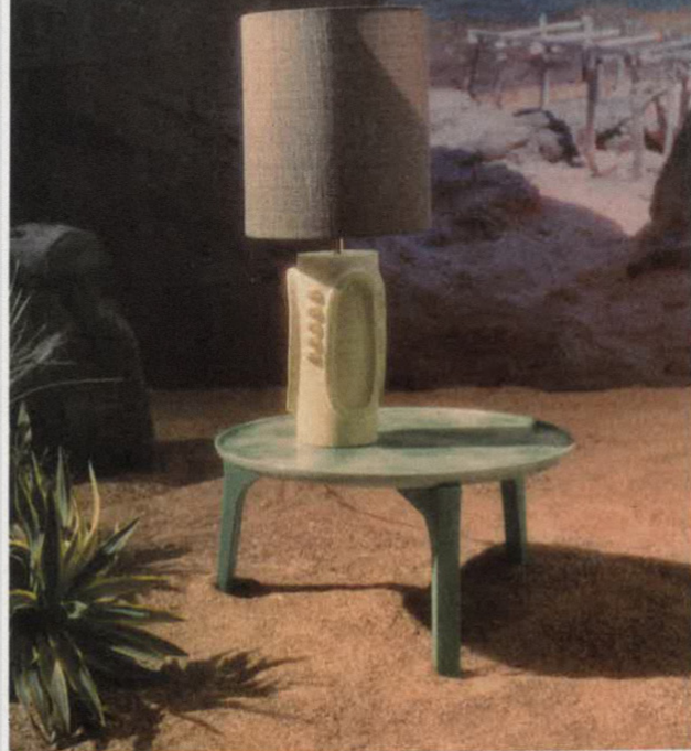
Ci-dessus. Bout de canapé BOW en grès émaillé, Roche Bobois, 1 790 €. Lampe en céramique signée Olivia Cognet, Graphic, 1 900 €.