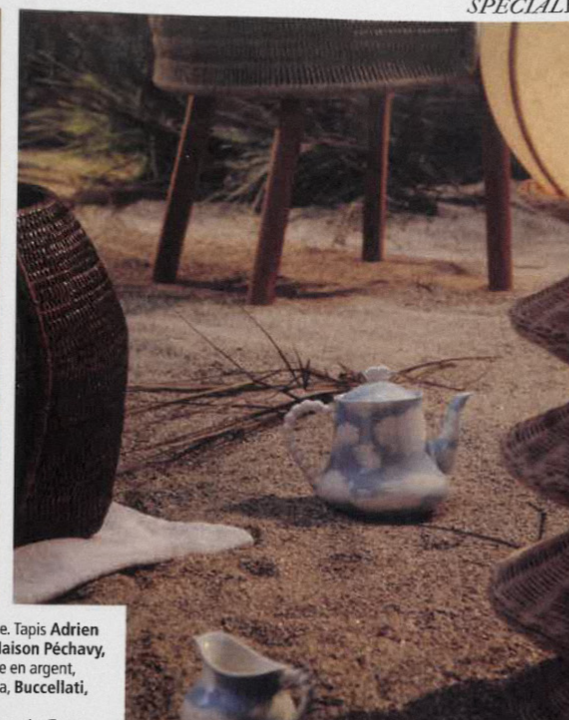
En haut à droite, panier Togo, Flamant, 345 €. Théière et pot à lait, Wouters & Hendrix pour Serax, 65 € et 30 €. Lampadaire Bilba, Honoré Déco 545 €. En bas à gauche. Table Erica, Antonio Citterio pour B & B Italia, 9 328 €. Soliflore Villa Arev, 350 €. Plat à tarte et assiette Natures Marines, Hermès, 550 € et 265 €. En bas à droite. Tapis Adrien Testard pour Maison Péchavy. Fauteuil Trio Outdoor, Studio MK27 pour Minotti chez Silvera, 6 209,80 €. Vase Achille, Armani Casa, 2 950 € pièce.