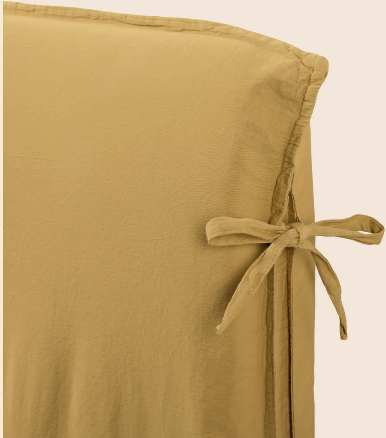
16. Housse de tête de lit Satheene terre mocha et jaune indien - satin de coton lavé - 99 € en 170x134 cm (existe en 3 tailles)