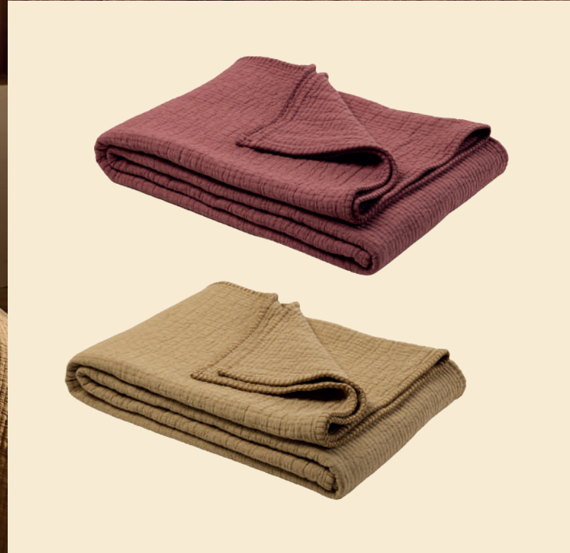
7. Couvre-lits Ilario terracotta et jaune paille - coton gaufré finition feston - 170x260 cm - 159 € (existe en 240x260)