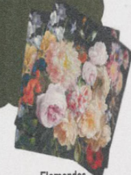
Flamandes Serviettes de table, en lin, 32 x 32 cm, 24 € les 4, LinenLove sur Etsy.