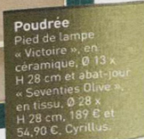
Poudrée Pied de lampe « Victoire », en céramique, Ø 13 x H 28 cm et abat-jour « Seventies Olive », en tissu, Ø 28 x H 28 cm, 189 € et 54,90 €, Cyrillus.