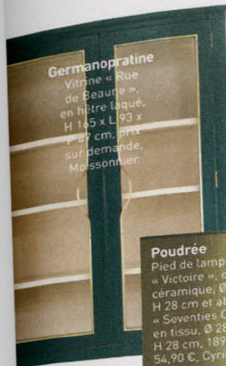
Germanopratine Vitrine « Rue de Beaune », en hêtre laqué, H 145 x L 93 x P 27 cm, prix sur demande, Moissonnier.