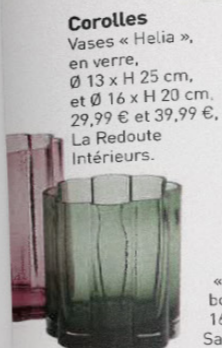
Corolles Vases « Helia », en verre, Ø 13 x H 25 cm, et Ø 16 x H 20 cm, 29,99 € et 39,99 €, La Redoute Intérieurs.