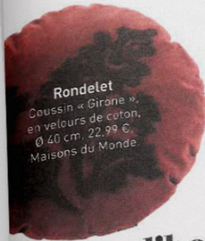
Rondelet Coussin « Girone », en velours de coton, Ø 40 cm, 22,99 €, Maisons du Monde.