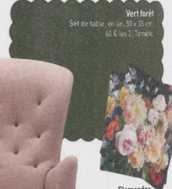
Vert forêt Set de table, en lin, 50 x 35 cm, 60 € les 2, Tomèr.