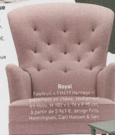
Royal Fauteuil « FH419 Heritage », entièrement en chêne, revêtement en tissu, H 102 x L 76 x P 95 cm, à partir de 5 961 €, design Frits Henningsen, Carl Hansen & Son.