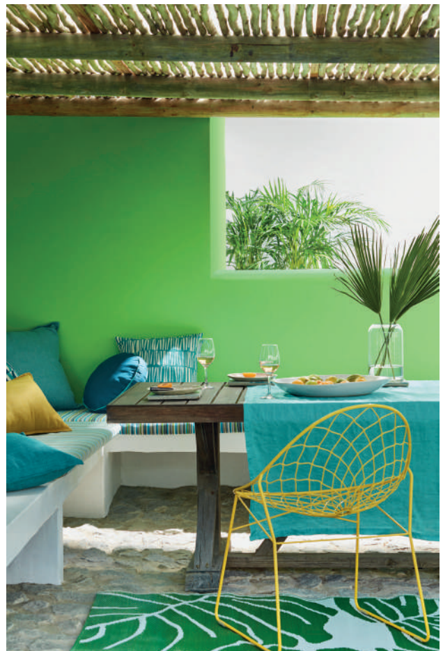
7. Phthalo Green™ 199. Slaked Lime™ 105.