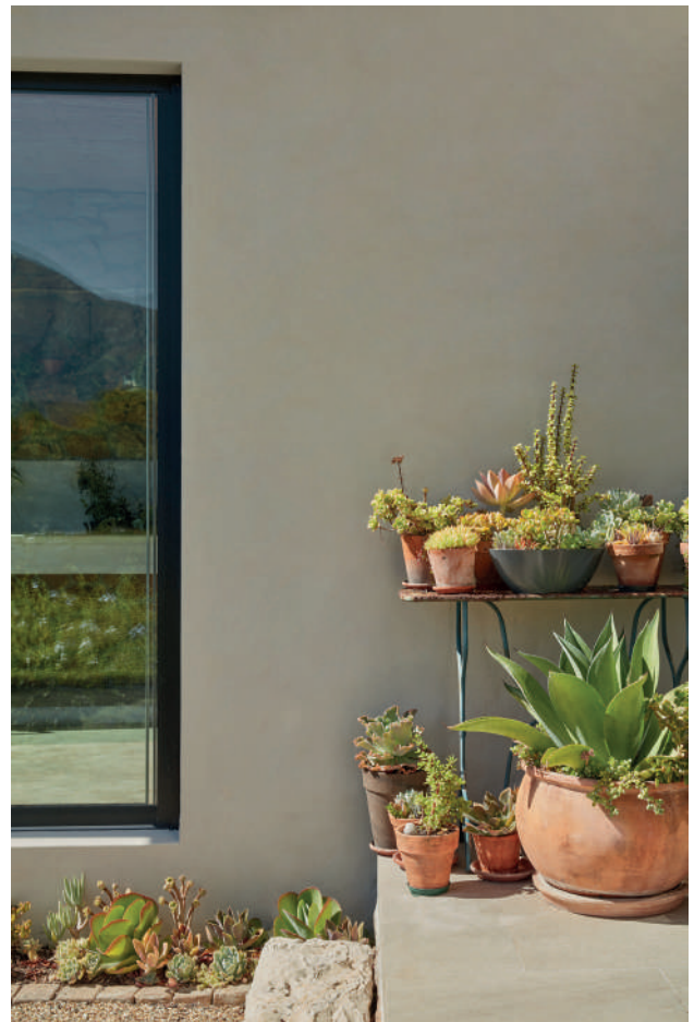
9. Serpentine™ 233. Jack Black™ 119.