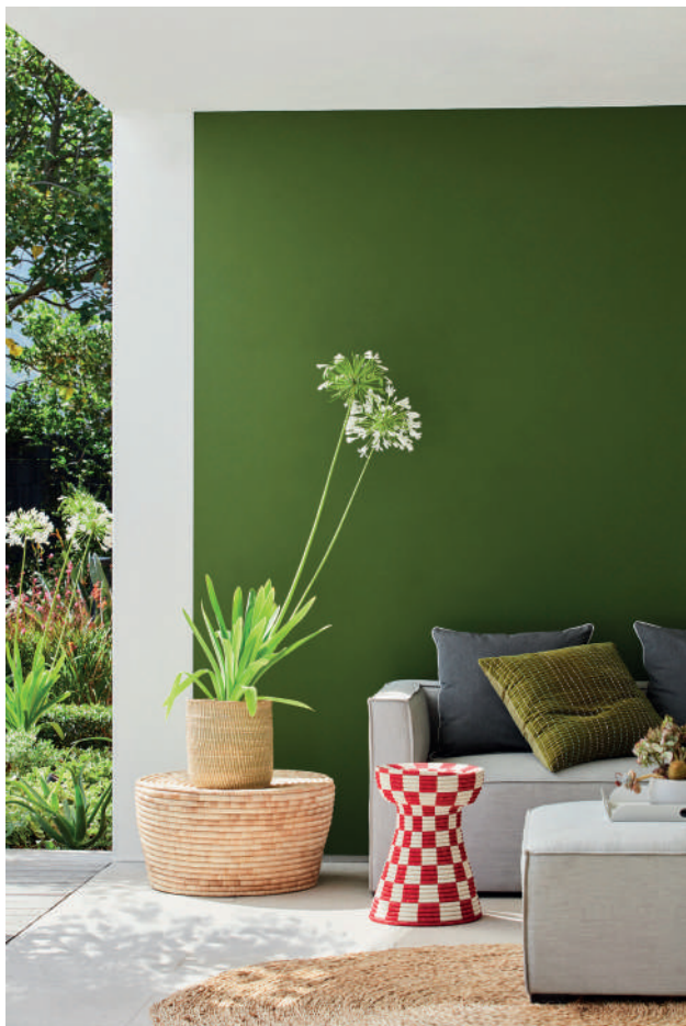
6. Slaked Lime™ 105. Jewel Beetle™ 303.