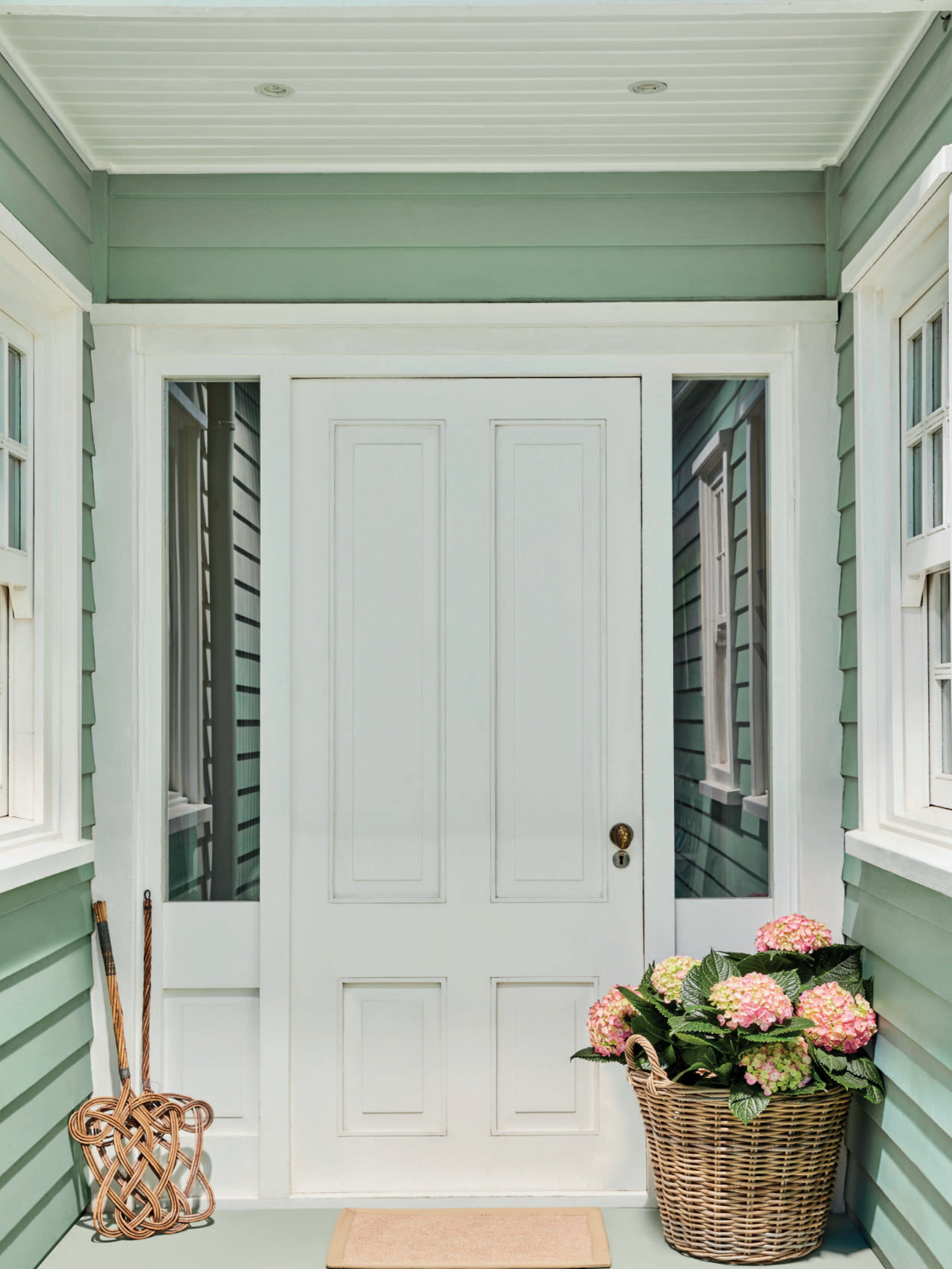
1. Shirting® 129. Aquamarine™ 138.