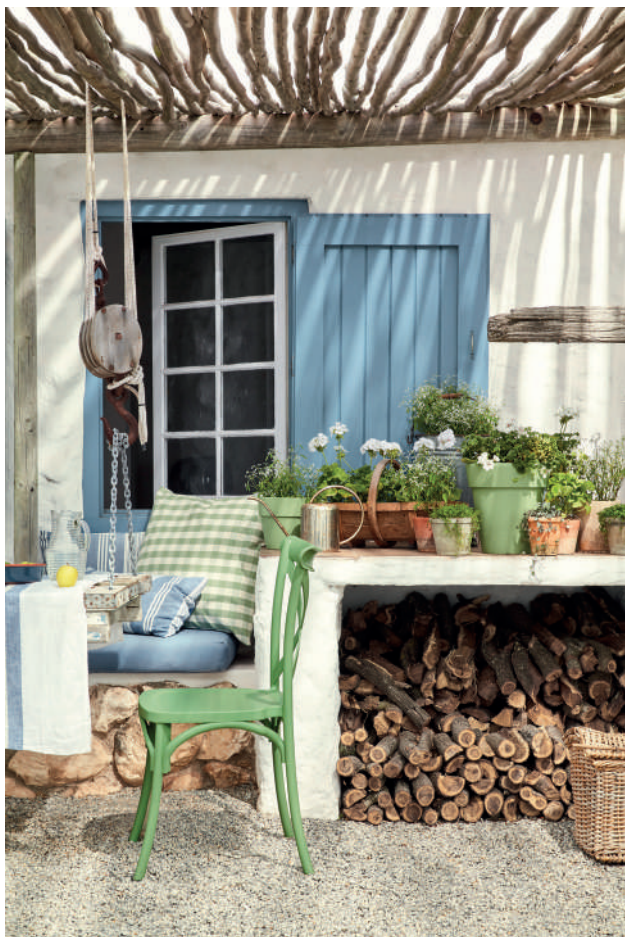
4. Shirting® 129. Grey Stone™ 276. Garden™ 86.