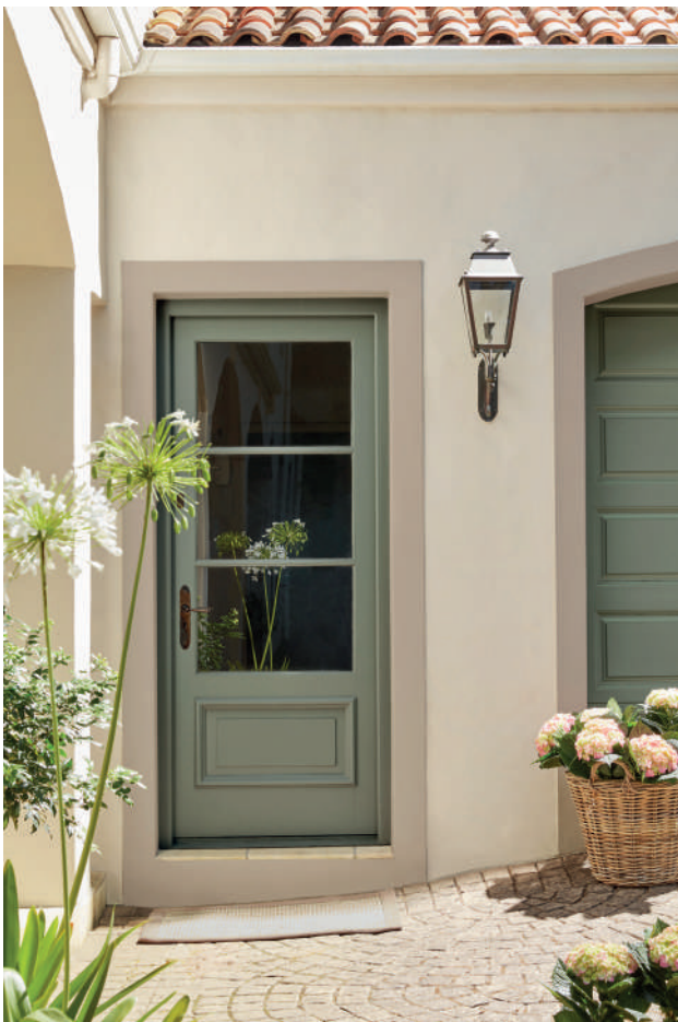
10. Travertine - Light™ 272. Rolling Fog® 143. Ambleside™ 304.