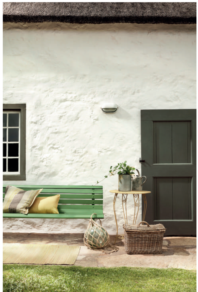
5. Stock™ 37. Invisible Green™ 56. Bassoon™ 336. Hopper™ 297.