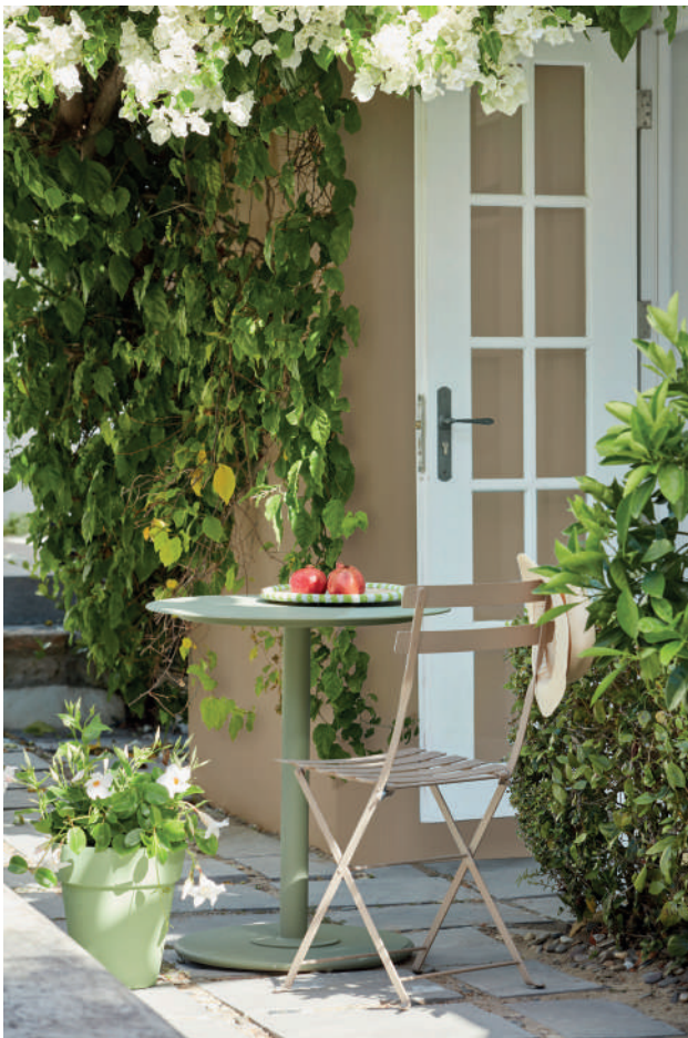
8. Lute™ 317. Shirting® 129. Sage Green™ 80.