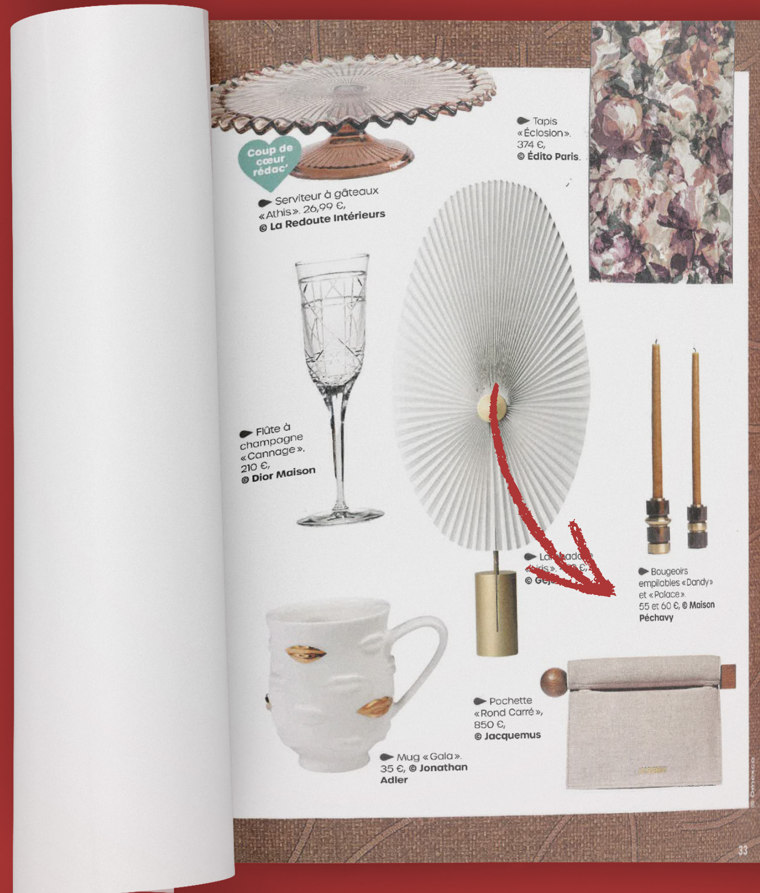
Maison Pechavy - Bougeoirs empilables « DANDY» et «PALACE»