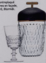
Patrimoniaux Baladeuse « Folie », en cristal et frêne noir, finition aluminium anodisé bronze, Ø 15,4 x H 29 cm, 1750 €, et verre en cristal « Marie-Antoinette », Ø 8,8 x H 14,1 cm, 100 €, l'un ou 300 €, les 4, Saint-Louis.